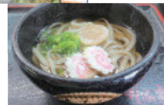
かりん亭の手打ちうどん